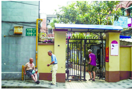
山阴路一小区门口,两位市民纳凉聊天。