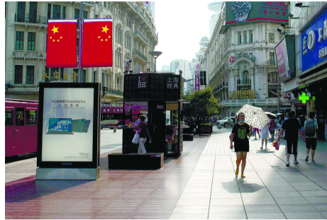
南京路步行街上,路人都躲到路边阴影里行走。