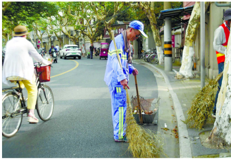
祥德路上,一位环卫工的工作服已湿了一大半。