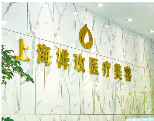
位于闵行申长路 1588 弄的上海桦玫医疗美容