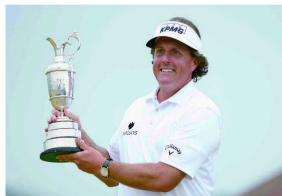
劳力士代言人、美国高尔夫球员菲尔·米克尔森在2013年夺得英国公开赛冠军

睽违两年回归的英国公开赛，吸引了156位知名高尔夫球员来此挑战，只为收获那尊闪耀的葡萄酒壶奖杯和“年度冠军球员”（Champion Golfer of the Year）的荣耀。作为大会计时，劳力士也一同亮相皇家圣乔治高尔夫球俱乐部，标志着此运动领域赞助中最具标志性的合作关系之一已迈入40周年。