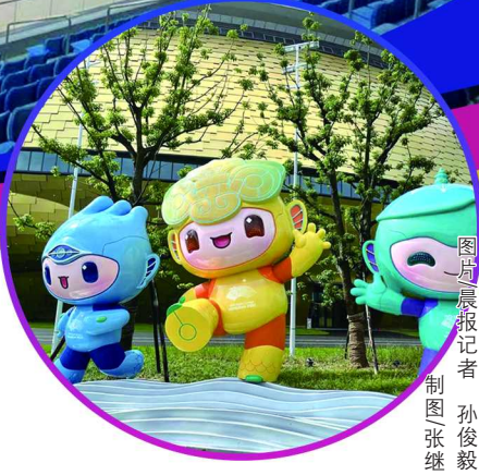
图由晨报记者 制图张继 孙俊毅