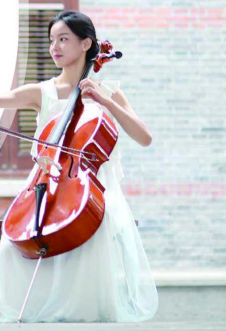
制图 / 潘文健