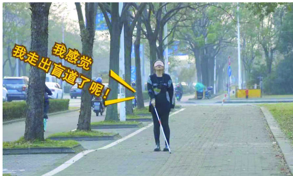
检察官蒙眼体验盲道行走