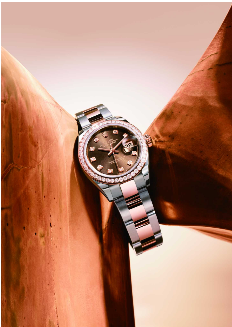
女装日志型永恒玫瑰金钢款，外圈镶46颗圆形切割钻石，巧克力色表盘镶10颗钻石。

于是，1957年，一款专门为现代女性设计的经典時計——蚝式恒动女装日志型（Oyster Perpetual Lady-Datejust）应运而生，在小巧玲珑的尺寸之间，诠释坚定不移的卓越标准。这款专为女性而生的時計精准可靠，足以媲美男装腕表。高雅与精准、优雅与坚固、美态与性能，在此腕表上完美展现。