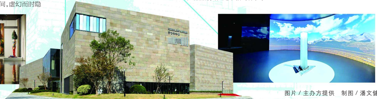
图片/主办方提供 制图/潘文健

这道甜品有很直观的南瓜模样,切开南瓜,里面包裹着香草味的冰淇淋和芒果粒,口感软糯、甜而不腻。看完展览,来一块草间弥生同款南瓜甜品,实在是个新奇体验。