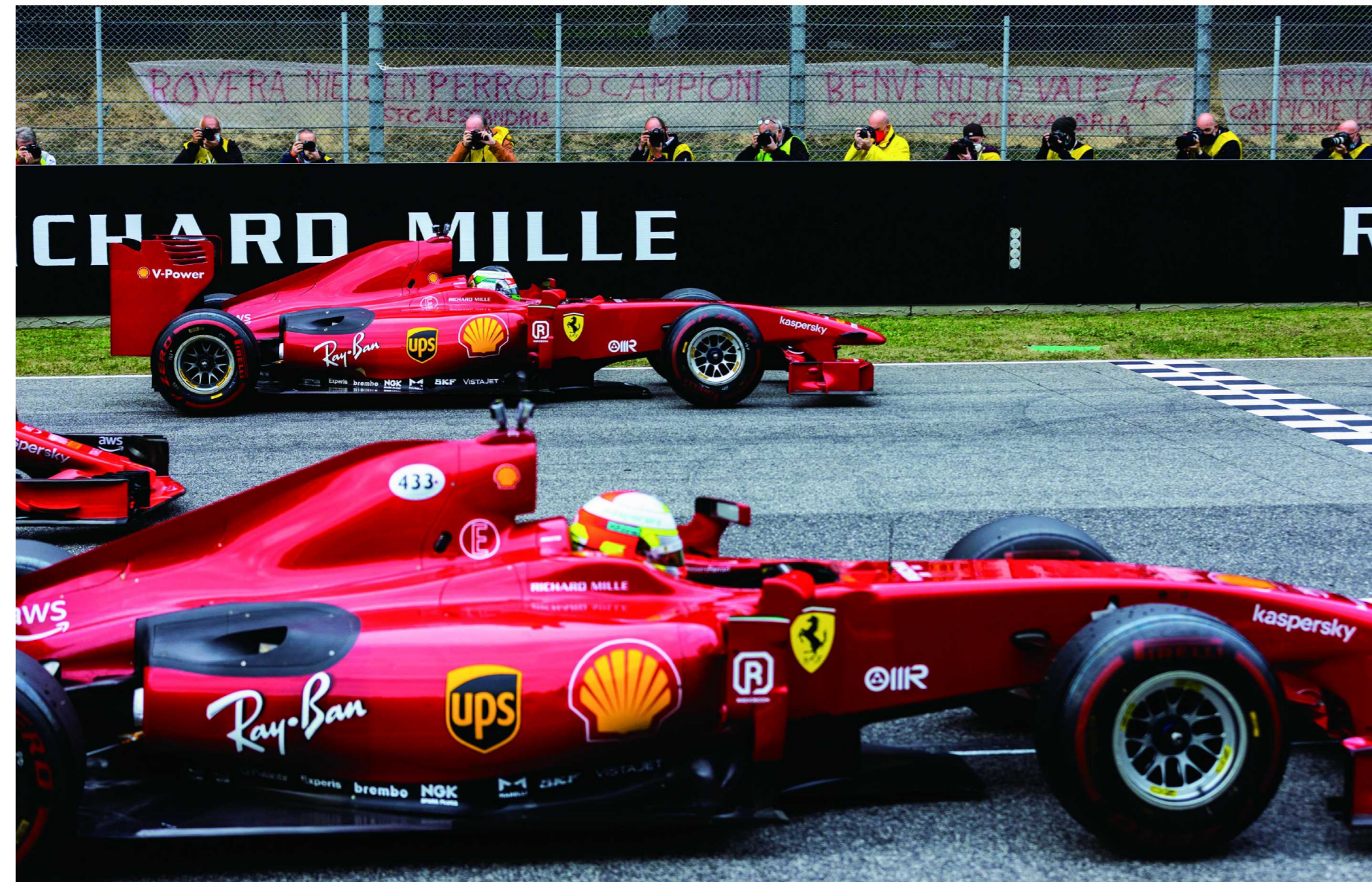
RICHARD MILLE 迎来2021年全新合作伙伴法拉利 (Ferrari)