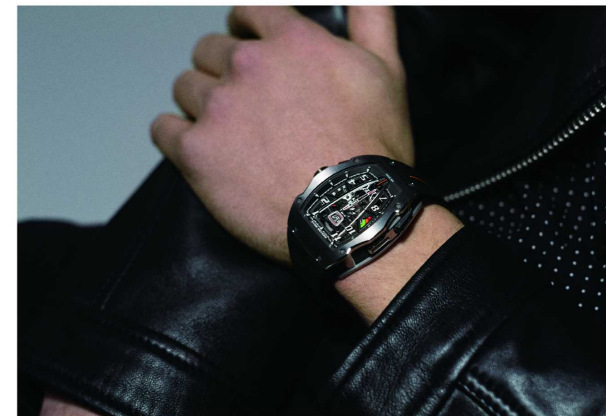
RM 40-01迈凯伦Speedtail自动上链陀飞轮腕表