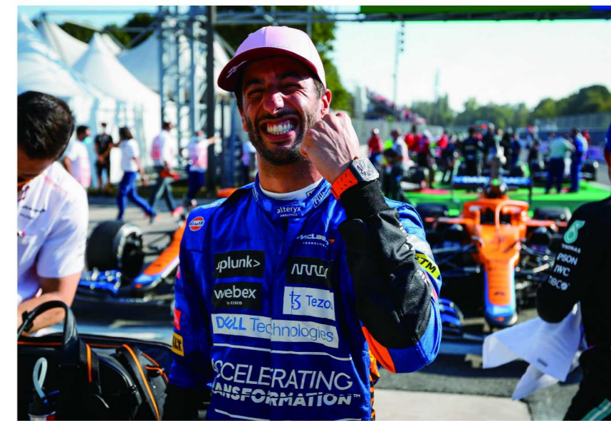
迈凯伦F1车队在2021赛季赛道实拍