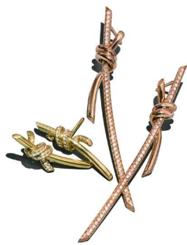
Tiffany & Co. 蒂芙尼 Knot 系列耳环

Tiffany Knot 系列采用精湛技艺和创意巧思，以玲珑有致的绳结设计打造手镯、戒指、项链、吊坠及耳环等珠宝作品，鲜明棱角与流畅线条相映成趣，独具个性之美。18K 黄金、玫瑰金以及铺镶钻石的运用，将光泽曲线与锐利锋芒巧妙融合，象征坚不可摧的彼此联结，为该系列作品增添丰富的立体质感。即日起，全新 Tiffany Knot 系列已于蒂芙尼官方线上平台和线下精品店同步呈现。