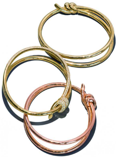
Tiffany & Co. 蒂芙尼 Knot 系列 18K 黄金双行手镯及 18K 玫瑰金双行手镯