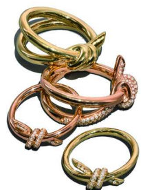
Tiffany & Co. 蒂芙尼 Knot 系列戒指