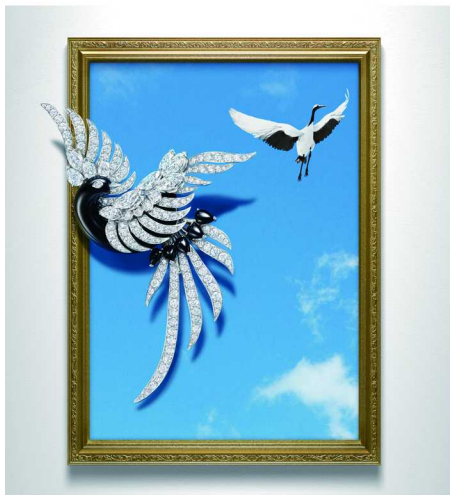
Black Necked Crane 胸针

金绿宝石，与广阔的绿色草地相互映衬，矢车菊蓝色的灵蛇和紫色蝴蝶流连于此。流水潺潺的小溪旁可见跳跃的鱼儿和优雅的鸭群，而妆点宝石的鸟儿在高空悬停相鸣，嘤嘤成韵。