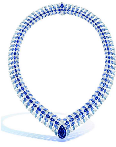
Blue Python 项链