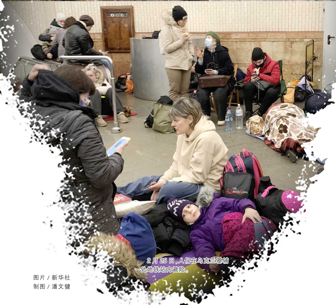
2月25日,人们在乌克兰基辅一处地铁站内避险。