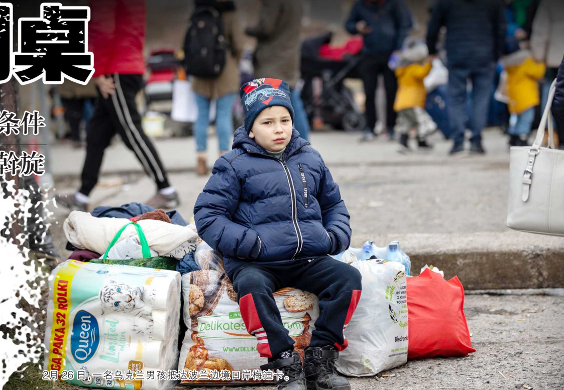
2月26日,一名乌克兰男孩抵达波兰边境口岸梅迪卡。

据乌克兰媒体报道,25 日晚,基辅一名孕妇在警察和市民的帮助下,在避难的地铁站里生下了一名女婴。