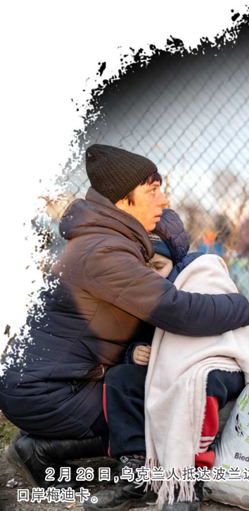
2月26日,乌克兰人抵达波兰边境口岸梅迪卡。