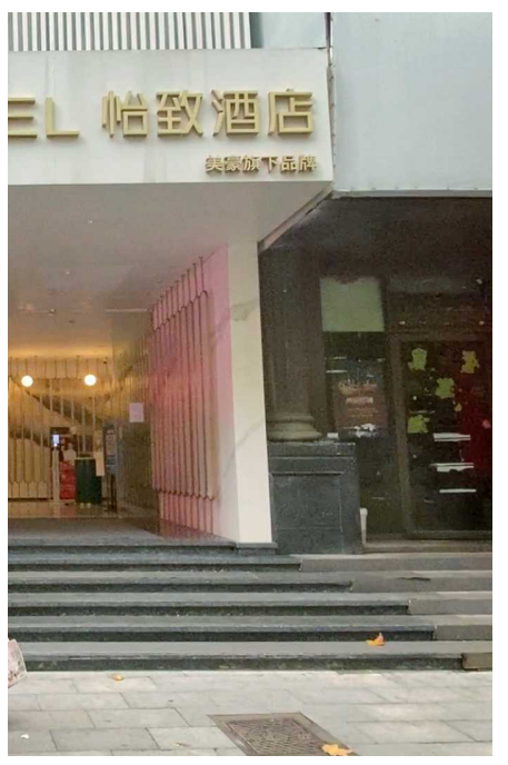
美豪怡致酒店上海长寿路店外景