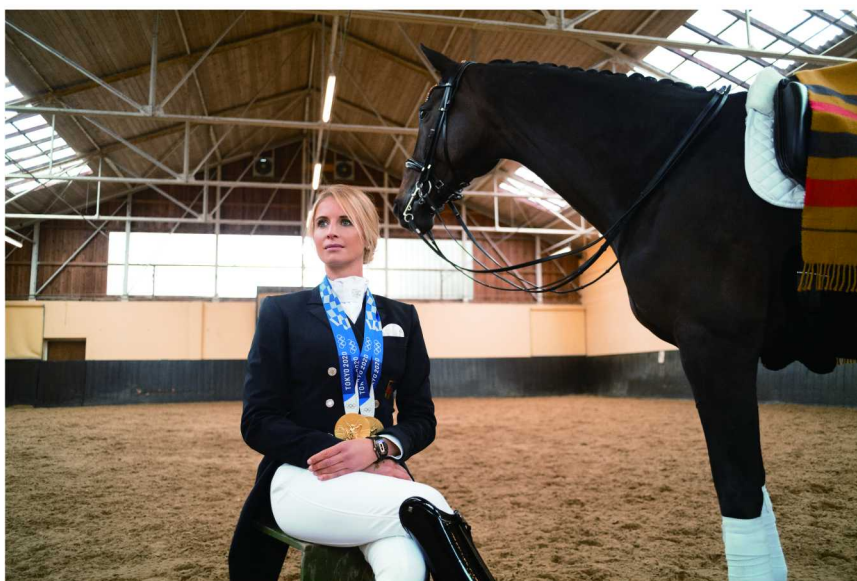
RICHARD MILLE品牌挚友、马术选手Jessica Von Bredow-Werndl