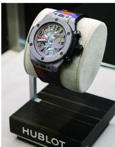
宇舶秉承“融合的艺术”突破性制表理念逐步推出融合创新设计的诸多腕表系列

中的不懈探索与跨界合作充分彰显了品牌“融合的艺术”精髓所在，更携手 SORAI 慈善组织以及“极地舱”（Polar Pod）探险项目开展环境保护相关合作，皆在展现品牌基于当今热点问题的高度关注。