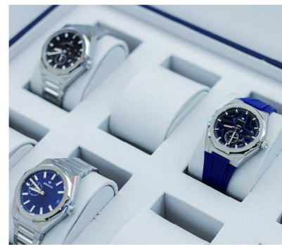
ZENITH 真力时携 DEFY 系列全新力作重磅亮相：DEFY SKYLINE Skeleton 镂空天际腕表等多款杰出作品参与展出