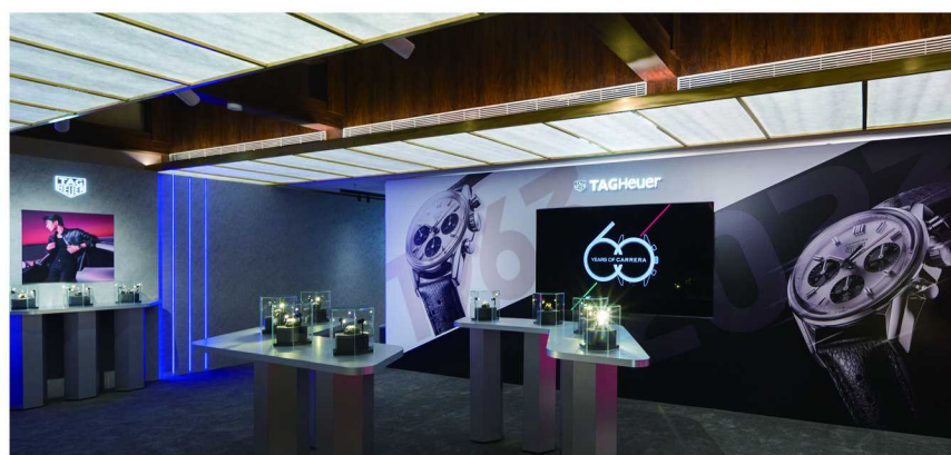
泰格豪雅作为于 1860 年创立的奢华腕表制造商亦是 LVMH 集团引以为傲的腕表品牌

泰格豪雅是爱德华·豪雅（Edouard Heuer）于 1860 年创立的奢华腕表制造商，163 年来始终处于机械制表前沿，不断巩固精湛制表技艺和美学理念的杰出声誉。