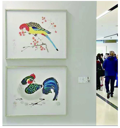
天趣——陈家泠特展 策展人 赵建军、陈亮 时间 5月21日至7月21日 地点 CMG融媒影城(徐汇区龙文路19号2层)