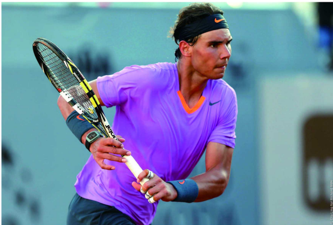
纳达尔佩戴 RM 27-01 腕表

RICHARD MILLE 理查米尔在设计上同时结合了人体工学与各种实用化的功能，配合着独特的审美风格，开创了现代制表业的最新潮流。这一点从那些极限运动高手身上，尤其得到了鲜活生动的体现。