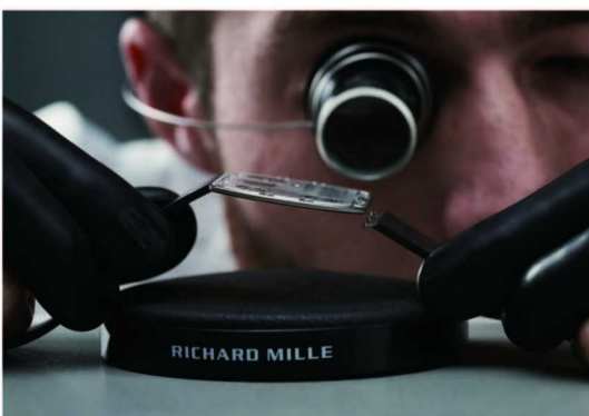
RM UP-01 Ferrari 超薄腕表

在机械的设计方面，RICHARD MILLE 理查米尔选择将无法叠加的零部件，分散到更宽的平面，创造出机芯与表壳的完美共生，同时彼此间保证两者所必须的刚性，这样该表完全脱离了“概念”，成为真正能够日常佩戴的表款。并且，它的机芯可以承受超过5000 g 的加速度，因此格外耐冲击与震动。