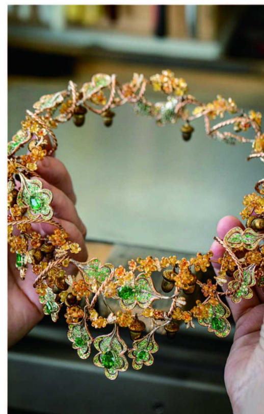
萧邦 Red Carpet 橡树项链

Chopard 萧邦自 1998 年以来一直是戛纳电影节的官方合作伙伴，2024 年全新 Red Carpet 系列也将让戛纳的滨海大道熠熠生辉，礼赞这项备受尊崇的影坛盛事。