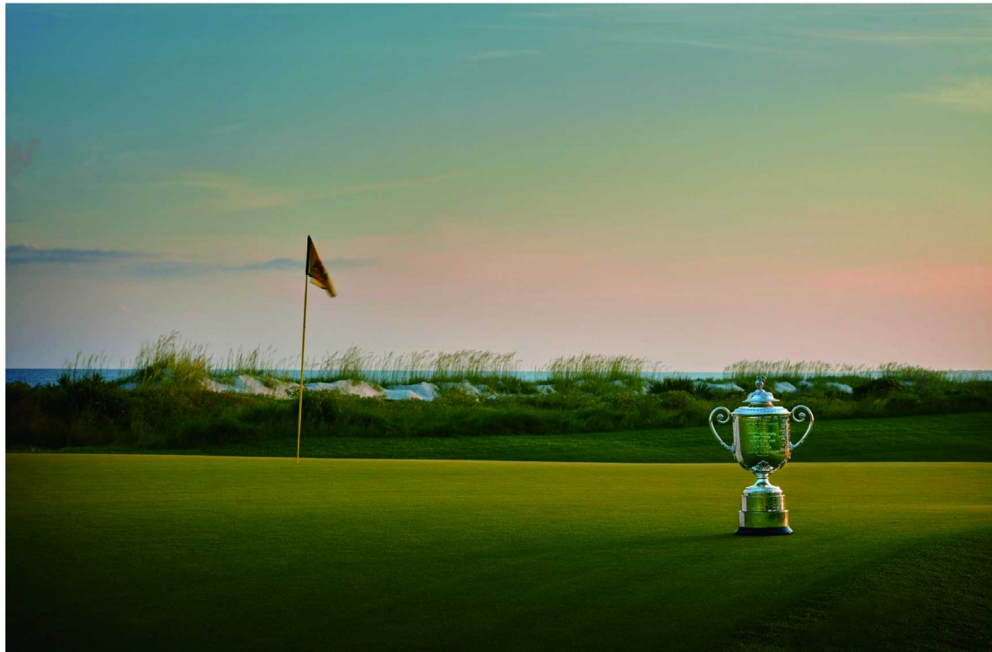
第103届PGA锦标赛沃纳梅克杯掠影