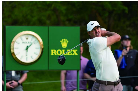
劳力士代言人布鲁克斯·科普卡在第105届PGA锦标赛决赛中挥杆

在高尔夫四大男子大满贯赛事中，美国PGA锦标赛（PGA Championship）是唯一一项仅限职业选手参加的赛事。本年度第106届美国PGA锦标赛于5月16日至19日在肯塔基州路易维尔的瓦尔哈拉高尔夫俱乐部（Valhalla Golf Club）揭幕。各路高尔夫球精英相聚赛场，为观众奉上精彩绝伦的巅峰对决。