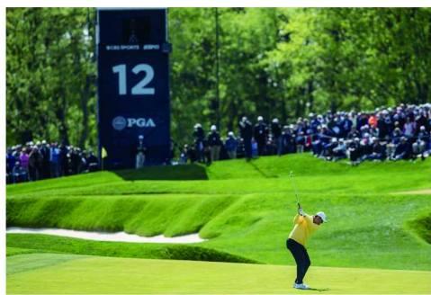
劳力士代言人斯科蒂·舍夫勒在2023年PGA锦标赛的第十二洞挥杆