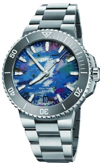
ORIS 豪利时 Aquis Upcycle 日历腕表

1995年葡萄牙系列追针计时腕表的问世，标志着计时正式加入葡萄牙系列，从那时起，这项功能便为葡萄牙系列增添了清新简洁的运动风格。作为表款的一大特色亮点，印有四分之一秒刻度的表盘凸缘可精确读取累计计时时间，赋予腕表实用属性。今年，万国为计时款推出全新色彩盘面，分别为地平线蓝、曜石黑和沙丘金，细腻的表盘制作工艺极具挑战性。