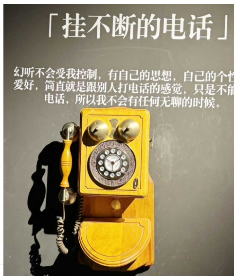
黑色博物馆里的展品

为何想要开设这样一家博物馆？聊起初衷，Alex 讲述了一个故事：他曾经在南京的艺术展上看过一张精神分裂症患者的画，纸上画的是一坨一坨的东西，让人摸不着头脑。经过了解，他才知道那是一条盘山公路，层层叠叠螺旋着交错在一起，“我们是俯视视角什么都看不出，可他们却是上帝视角，我很好奇他们的世界到底是什么样子的。”同时，他在生活中发现，有很多人给这些精神疾病患者污名化，甚至