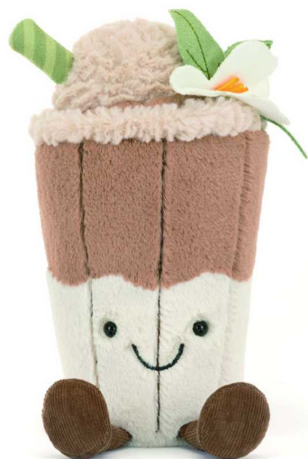
Jellycat 趣味玉兰妮娅拿铁

“不用为它们做任何事，它们都会陪在你身边”的陪伴感，让越来越多都市人开始重燃对可爱毛绒玩具的喜爱。来自英国的 Jellycat (中文名: 吉利猫)，也成为年轻人的新宠。