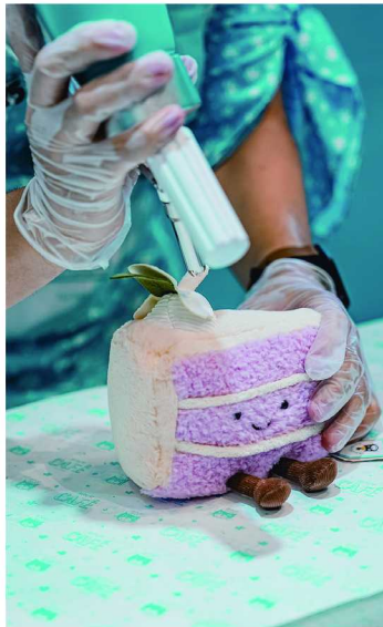
右:Jellycat CAFÉ 上海限时体验店 左:店员正在进行限定品打包

CC 在当今快节奏的生活中，人们愈发重视产品所传递的情感，而不仅仅是其外观与功能。对于情绪价值关注的持续提升，也成了许多时尚品牌的设计新趋势。无论是温暖的色彩、可爱的形象，还是舒缓身心的体验，设计师们试图将情感融入产品的每一个细节，用充满温度的设计，为都市人在忙碌的日常中带来更多满怀可爱的“情绪搭子”。