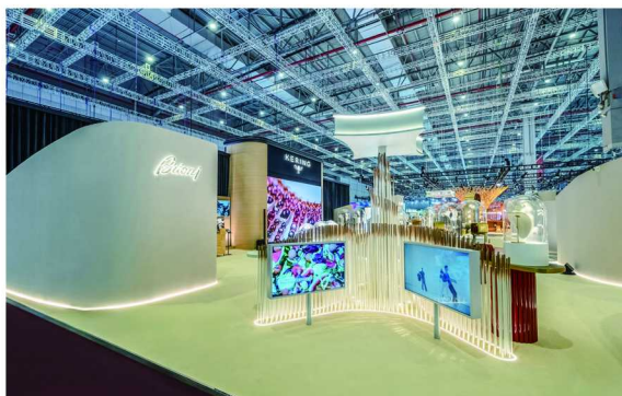
左：第七届中国国际进口博览会开云馆 / 中：开云馆古驰展区 / 右：开云馆巴黎世家展区