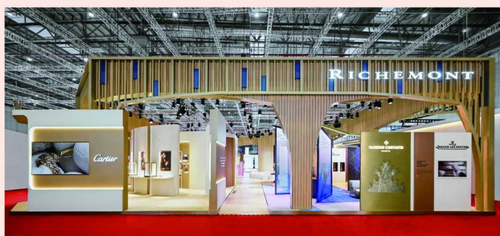
左：历峰集团进博会展厅 / 右：历峰集团旗下品牌卡地亚专题研讨会