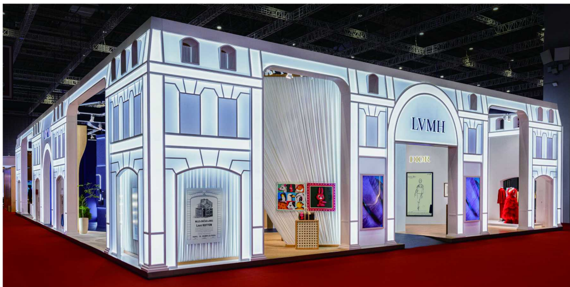
第七届中国国际进口博览会 LVMH 集团展厅

为加强在可持续发展方面的承诺，LVMH 集团与太古地产正式签约，进一步减少在中国的店铺、办公及餐饮场所的能源使用。作为全球精品时尚行业的引领者，LVMH 集团始终致力于守护地球家园、保障消费者安全、确保原材料的真实性，并通过融合传承与创新实现卓越表现。