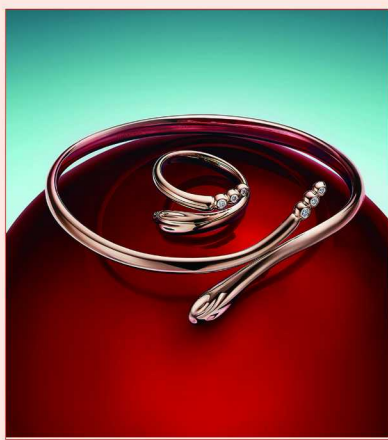
Tiffany Elsa Peretti® 系列 Snake 手镯及戒指 18k 玫瑰金镶钻，中国限定款

通过充满巧思的视觉演绎，Tiffany & Co. 蒂芙尼以经典 Tiffany Lock 系列为焦点，呈现 2025 新春广告大片，传递属于新春佳节的美好爱意、欣荣与希望。