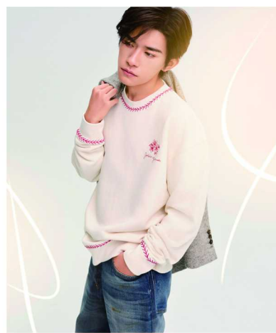
Golden Goose 品牌全球代言人易烊千玺演绎蛇年限定系列形象大片

全新蛇年限定系列融合了当代风尚与文化传承：中性风的水洗牛仔裤呈宽松版型，后袋饰以精致蛇形刺绣图案，灵动展现佳节气息；中性风圆领卫衣等经典单品，以手工刺绣红色花卉和品牌标识点缀，展现隽永格调；做旧白色 T 恤饰以夺目的水晶蛇形图案，米色宽松羊毛大衣则采用抽象蛇纹印花，风格百搭，为节日季带来焕然一新的创意视角。