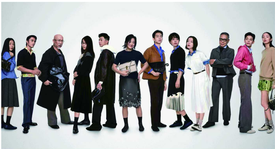
Prada 全新 2025 春节广告大片