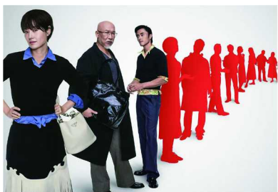
Prada 全新 2025 春节广告大片

大片发布之际，Prada 推出精选成衣与配饰产品，并正式推出品牌播客——“蛇年说蛇”，通过与文化界翘楚的对话，透过多元视角，探索蛇的形象于不同语境和艺术形式中的角色。