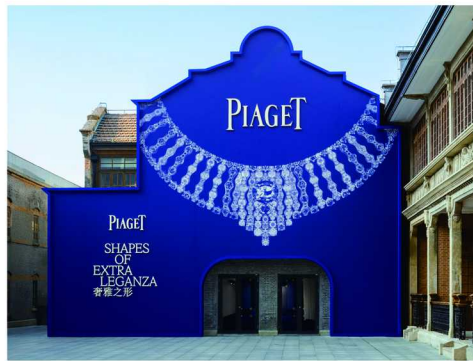
PIAGET 伯爵“优雅亦不羁”限时体验展

整场展览既承载着跨越世代的记忆，亦见证着品牌美学的更迭新生。布契拉提家族表示：“进入中国内地市场近十年，中国市场对美学与历史的深刻鉴赏力，必然能与品牌隽永的艺术匠心产生深刻共鸣。”