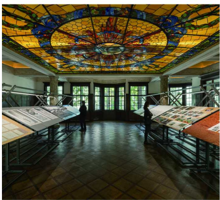
《一种语言》于 PRADA 荣宅的展览现场

CC 在这座文化活力不断升温的城市里，展览早已不再只是“走进展厅、看几件作品”的固定路径。越来越多的展览正在以新的方式调动观众的感知系统：用耳朵倾听工艺在百年档案中留下的回声；用眼睛捕捉电影语言由一帧到一秒的构成逻辑；用讲述的方式重新理解珠宝与空间在当代语境中的延伸意义。当不同的技艺、影像与光泽在展厅内对话，一幅关于城市文化能量的更大地图，也在悄然展开。