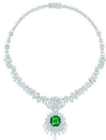
PIAGET 伯爵“Shapes of Extraleganza 奢雅之形”高级珠宝系列 Gleaming Shapes 溢彩之形主题项链

值得一提的是，展厅之外，伯爵首次在上海张园开设的精品店同步亮相，空间延续展览的设计逻辑，串联“形态多元”“精湛金工”“极致超薄”三大主题。与其说是零售空间，不如说是品牌档案室的当代版本：从造型设计、黄金工艺到机械美学上的传承，伯爵的长期美学脉络在此得到了更为直观的呈现。