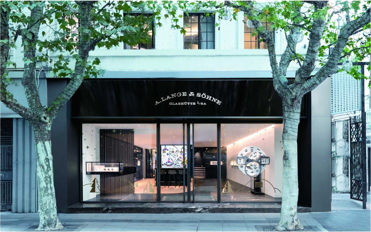
朗格上海旗舰店焕新开幕于南京西路1169号