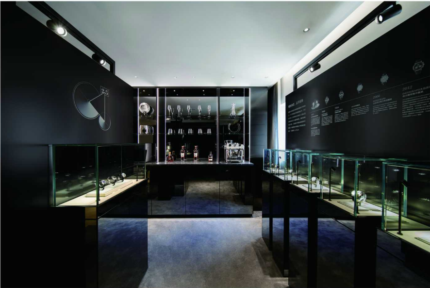
现代腕表展区聚焦于LANGE 1 朗格1系列与朗格计时腕表作品

朗格全球总裁Wilhelm Schmid表示：“回望传统工艺之源，费尔迪南多·阿道夫·朗格打造至臻腕表的远见卓识，至今仍清晰映现于我们的制表之道。其曾孙瓦尔特·朗格在1990年12月7日复兴朗格品牌时，恰逢曾祖父创立制表工坊145周年纪念日，他始终秉承同一信念。瓦尔特·朗格承扬先辈成就，我们欣喜能藉由全新的朗格上海旗舰店向钟表爱好者生动诠释其座右铭‘永不止步’的深意——这一精神至今仍指引着我们不断前行。”