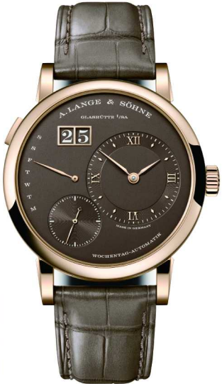
朗格表厂180周年之际推出的LANGE 1 朗格1逆跳星期自动腕表750蜂蜜金款