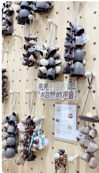
各种果实外壳做的手摇铃