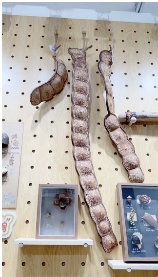
用云南一种植物的豆荚做的文创