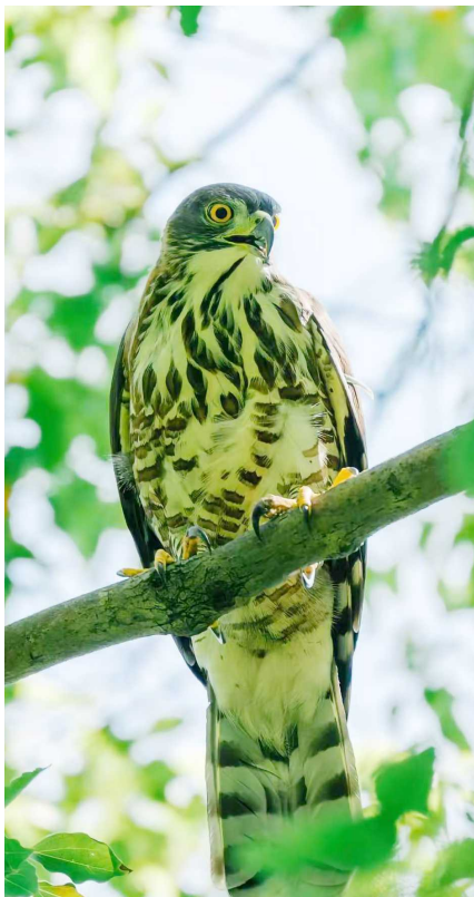
“守望者 WARDEN”拍摄的凤头鹰