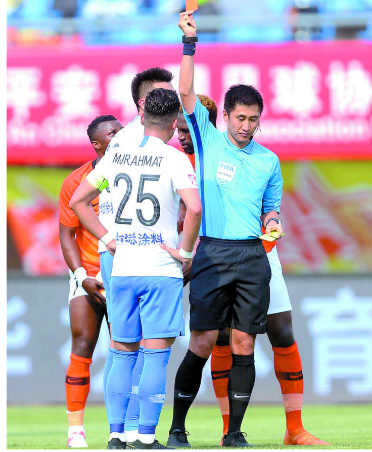
中国足协在培养教练员方面做出的努力得到了亚足联认可与肯定

可。确定了从D级至职业级教练员培训的框架体系、针对年龄段、球员发展等相关内容,完善了培训体系。 教练员讲师工作方面,中国足协自2008年开始致力于本土教练员讲师的培养和发展,2017年进入发展阶段,2018年得到亚足联认可并进入快速发展阶段。通过努力,相较于前一年,2018年的D级助理讲师及主讲师增长100余人,C级主讲师增长14人,B级主讲师增长10人,A级主讲师增长1人。 里皮、卡佩罗、斯科拉里、佩莱格里尼……近年来一个个如雷贯耳的名字出现在中国足球场边。世界级名帅或许在技战术理念上为中国足球带来了新意,却无法从根本上解决本土高水平教练员匮乏的现状。如今中国足协获得亚足联职业级教练员培训资质认证,为培养高水平教练员打通了向上的通道,不仅进一步与国际接轨,统一标准,使进阶制度更加完善,而且拥有了单独组织亚足联B级、A级和职业级教练员培训的自主权。未来中国校园足球、青训体系以及职业足球运动员不仅有望接受更多高水平教练员的指导,而且将提高对教练员的认可度,从而促进足球的普及和发展。 当然这只是“万里长征第一步”,距离持续输出高水平教练员并服务于整体发展,中国足球任重道远。