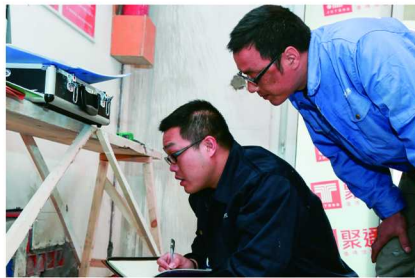
聚通质检员在施工现场作业中

电、泥木、油漆、竣工等四道专检。值得一提的是,聚通的专检分配工作采取“双盲派单”制度,派单由质检中心前一天进行随机匹配,项目经理和质检员都当天才知道对方名单,有效规避“人情质检”,确保检查的公平、公正。