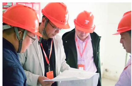
聚通装潢总经理(左二)带领巡检队检查工地

对于大多数消费者来说,想要亲自监督工程质量,却往往由于不清楚施工门道而不得要领。聚通的质检程序由专业人员层层把关,而“五级验收体系”中的最后一道——巡检,则是为施工质量再上了一道强力的“安全锁”。