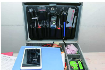
聚通为质检员配备的工具箱

“五级验收体系”中,自检是指施工队长带项目施工人员展开质量检查。复检则是项目经理请装修业主到场,共同就施工的内容逐一进行复查,业主如有疑问也可当场解答或及时调整。