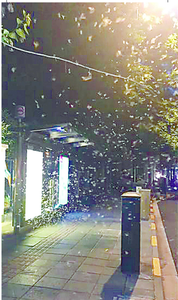
微博上, 市民拍到华山路湖南路一公交站白蚁成群飞出 /“这里是上海 shanghai”