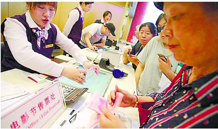
本版图片/受采访方