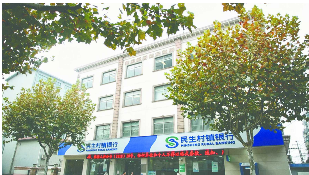
上海嘉定民生村镇银行