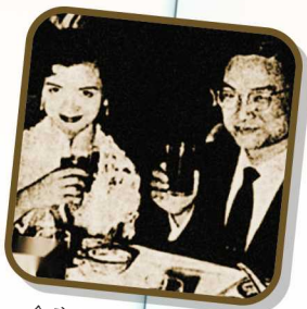
金庸与第二任太太朱玫