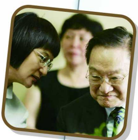
金庸与第三任太太林乐怡