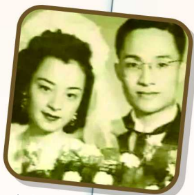
金庸与第一任太太杜冶芬