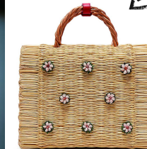
▲ Heimat Atlantica