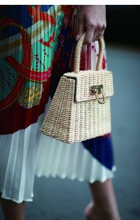
▲ Salvatore Ferragamo