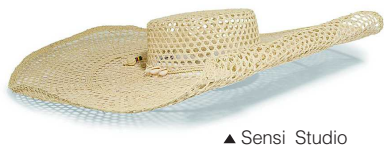
▲ Sensi Studio

然说大部分草帽不挑脸型，但你要真戴一顶 Jacquemus 的巨型草帽去海边，就会发现：现实真的不如照片美好。