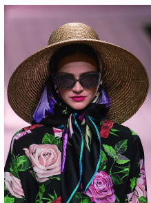
▲ Dolce & Gabbana