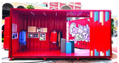
礼物一份！新会员更有机会获赠50元线上礼品卡一张！

近日，佛罗伦萨小镇正式开启夏日“意境”之旅，打造意式时尚派对新体验。来到小镇，流连于浪漫的意式建筑，拥抱夏日阳光，体验一场酣畅淋漓的意式狂欢。即日起至9月1日，众多精彩互动在佛罗伦萨小镇—上海名品奥特莱斯逐一上演。活动期间，每月更有多重夏季礼遇，覆盖不同品类单品，让你每天穿搭不重样！超百家环球名品为你带来更多潮流选择，就等你来嗨翻夏日时尚畅享之旅！