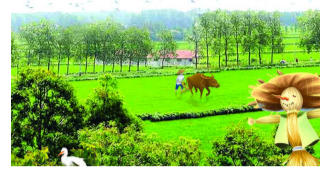
康的终极目标。为了坚守初心，瀛丰五斗手工有机大米种植过程中全程采用全域可视监控，实现大米生产过程全程可追溯。

稻米生产技术标准再次提升，形成手工有机稻米技术标准。本着热爱自然、尊重自然的初心，瀛丰五斗手工有机大米从生产环节上更加倡导去石油化，全面推广自然生态农法，用耕牛替代铁牛，用人工插秧替代机插秧，用紫云英、蚕豆豆粕绿肥和生物有机肥料替代化肥，用自然天敌赤眼蜂、狼蛛等生物和物理防治方法替代农药防治，从而达成环境更生态、土地更肥沃、生物更多样、系统更安全、稻米更健