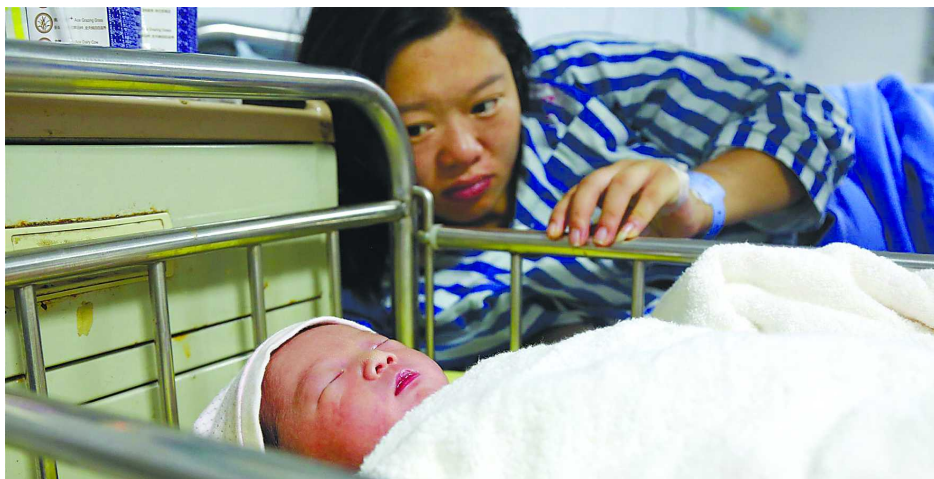
宜宾市矿山急救医院，“地震宝宝”和妈妈在一起（6月18日摄）。