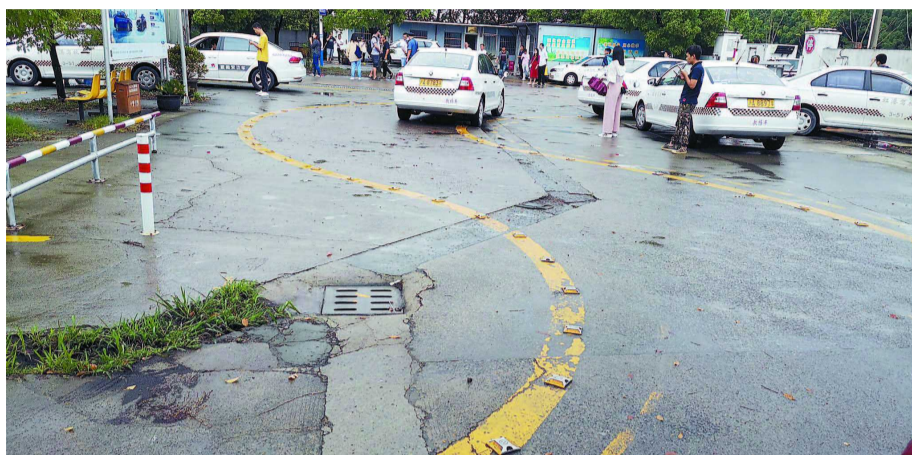
S弯项目两边车辆距离太近，容易酿成事故