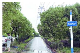
“坡道”设置两边是菜地