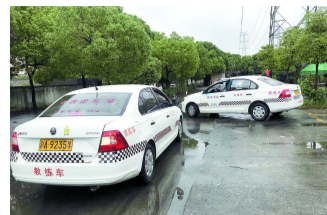
场地设置不符合正规训练基地标准