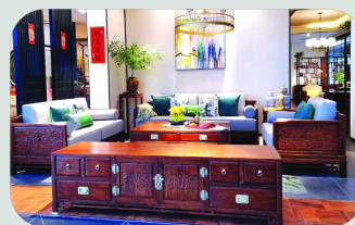
品牌:世代相传 展位号:C2E118