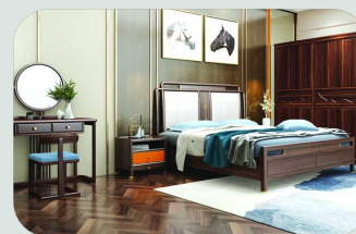
品牌:木容尚品 展位号:D2W123