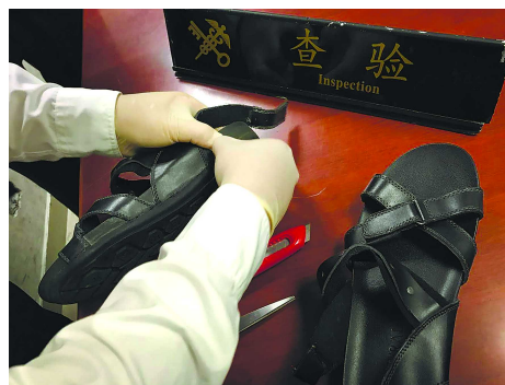
试剂检测,拖鞋内藏匿物呈可卡因阳性反应。