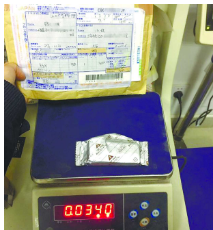
查获的国际包裹和新型毒品“蓝精灵”(右图)