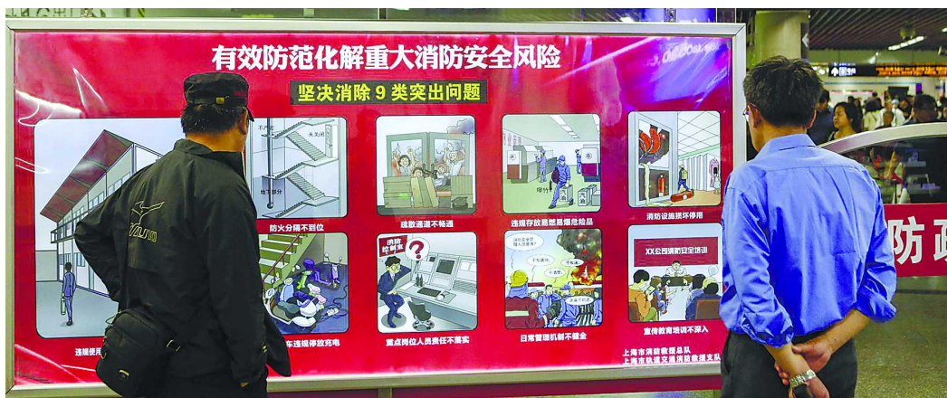
市民被醒目的消防宣传海报吸引住了

轨道消防表示,在消防公益宣传工作上,申通集团和上海消防一直密切配合,多年来通过打造消防宣传专列、印制发放消防宣传常乘票等形式,逐渐形成了有了上海地铁特色的消防宣传品牌,形成了固有的消防公益宣传阵地。此次,上海地铁消防宣传文化长廊揭幕,再一次充分利用了地铁受众面广、市民接触度深的优势,大大拓展了消防宣传的受众面。