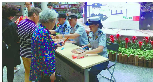
消防员在宣传消防安全知识