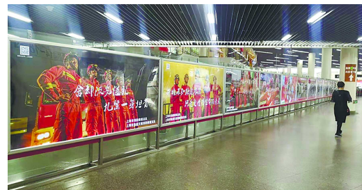
消防员斗志昂扬的精神面貌令市民们觉得非常“帅气”