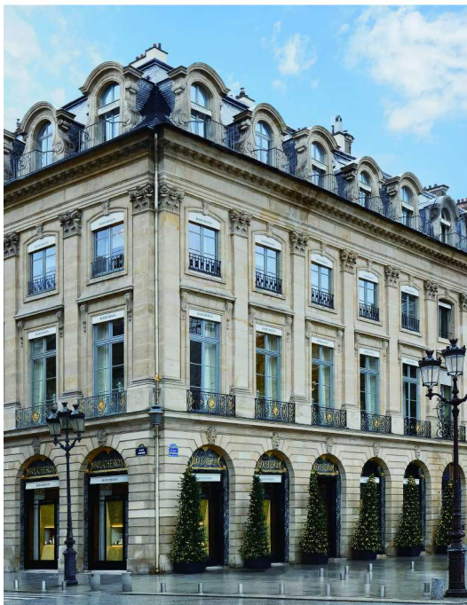
Boucheron宝诗龙于旺多姆广场26号的精品店