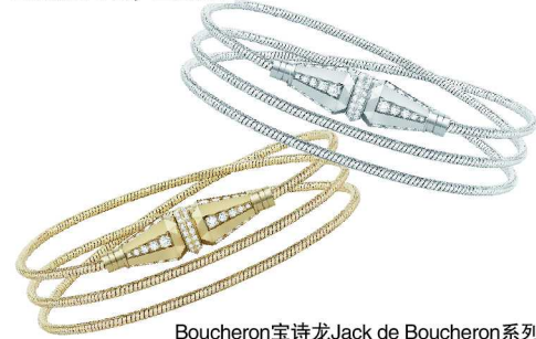
Boucheron宝诗龙Jack de Boucheron系列 黄金钻石手链，三圈链环