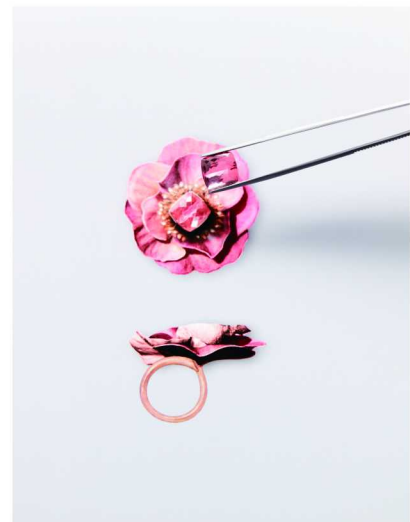
Boucheron宝诗龙高级珠宝作品秉承自由精神的设计理念，让女性自由轻松佩戴于身，释放真我风采

1858年，一个28岁的年轻人在当时巴黎的皇宫花园（Palais Royal）的拱廊下开设了以自己家族姓氏命名的珠宝店，他就是菲德烈克·宝诗龙（Frédéric Boucheron）。35年后，随着品牌的日益成功，为了找寻