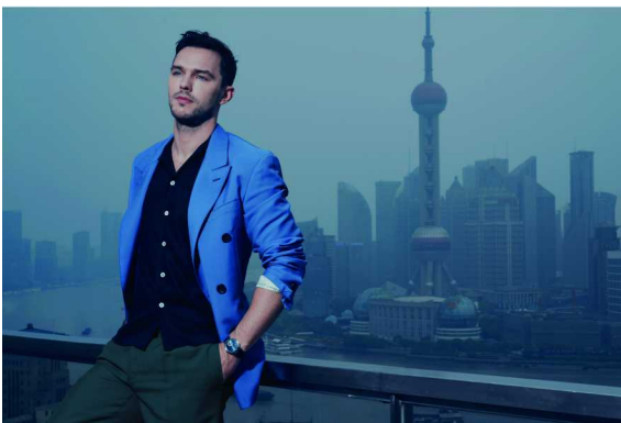
英国著名演员尼古拉斯·霍尔特（Nicholas Hoult）佩戴积家 Master Ultra Thin超薄大师系列月相珐琅腕表，尽显绅士风格

此外，积家还在慈善晚宴上捐赠了全球限量一枚的Rendez-Vous约会系列月相腕表—2019上海国际电影节慈善拍卖定制款，助力华语经典电影修复项目，拍卖所得款项将全部用于修复于1956年拍摄的电影《祝福》。