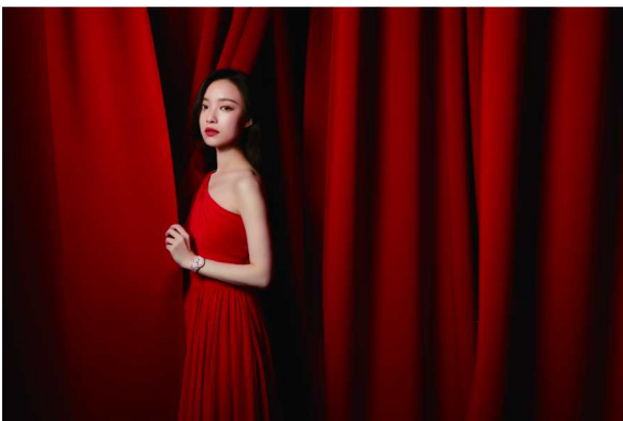
积家大使倪妮佩戴积家 Dazzling Rendez-Vous Night & Day约会系列日夜显示珠宝腕表（玫瑰金款）全新呈现“海上花开，约会时光”

积家对于精准艺术的热忱，持续并延伸至光影世界，关注并支持拥有相同艺术价值的电影文化。为致敬对电影艺术贡献卓著的中国电影人，继去年积家“电影人荣誉奖”首度闪耀上海国际电影节后，今年殊荣归属于著名电影人田壮壮，他对光影艺术不断探索的热情与积家执着于时间艺术的精神不谋而合。