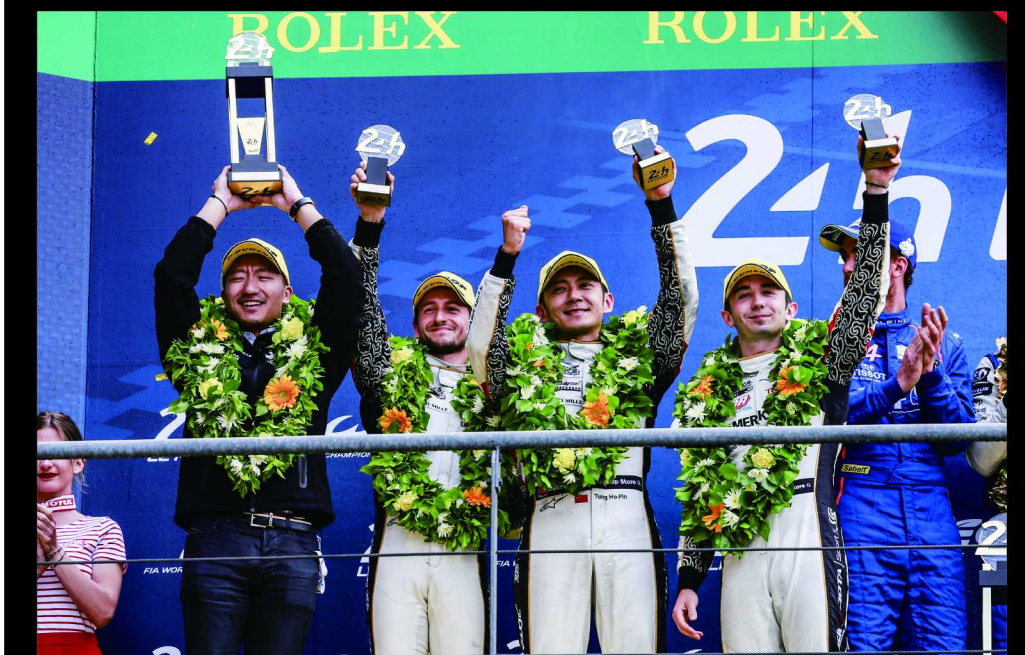
成龙DC车队以LMP2组第二的成绩登上领奖台