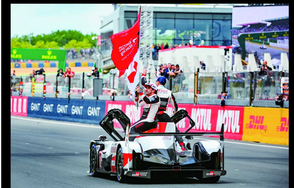
由费尔南多·阿隆索（Fernando Alonso）、塞巴斯蒂安·布埃米（Sebastien Buemi）和中岛一贵（Kazuki Nakajima）驾驶的丰田车队8号赛车获得2019勒芒24小时耐力赛LMP1组冠军