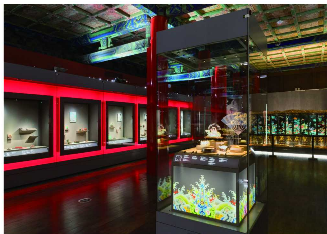
有界之外：卡地亚·故宫博物院工艺与修复特展灵感中国展厅

本次展览共设三个展厅，以“精湛技艺”为主轴，沿着时间和主题两条主线，进行多元视角的解读。展览集结了800余件艺术作品，最早的展品可追溯至明代。“有界之外：卡地亚·故宫博物院工艺与修复特展”是故宫博物院与卡地亚近年来合作成果的展示。展览分为灵感中国、风范见证、时间技艺三个单元，将中华优秀传统文化遗产同卡地亚所代表的近代跨越国界的创作结合，立体展现双方联合修复成果。通过展览，希望能够启发观众在欣赏中西方珍宝艺术的同时，领略珍宝艺术所富有的美感，感受技艺与工匠精神的积淀，关注展品背后中西交融的历史和意义。