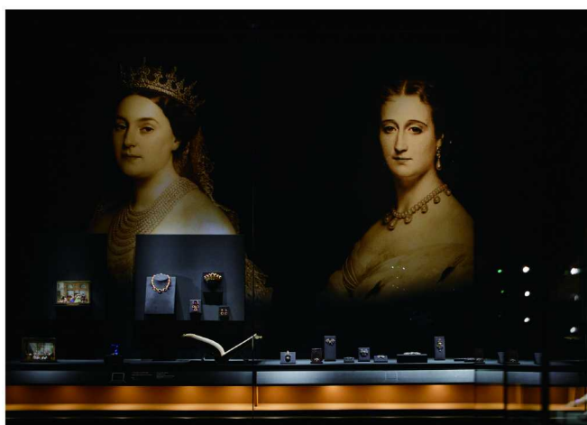
有界之外：卡地亚·故宫博物院工艺与修复特展风范见证展厅