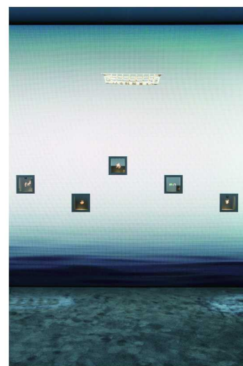
Van Cleef & Arpels梵克雅宝诺亚方舟高级珠宝系列展

Van Cleef & Arpels梵克雅宝L' ARCHE DE NOÉ高级珠宝系列再现动物王国的丰沛活力，向诺亚方舟这一经典传说致敬。世家以胸针生动诠释故事中60多对动物爱侣，方舟上的小动物与三种奇幻生物由璀璨多彩且珍贵的硬宝石生动再现，以刻画大自然的蓬勃生机与诗意盎然。Van Cleef & Arpels梵克雅宝融汇奇思妙想、非凡诗意与精湛工艺，创造出令人耳目一新的动物王国。