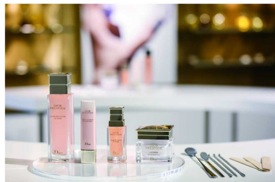
Dior迪奥花秘瑰萃系列区域产品展示

活动当天，各特色区域精心陈列着Dior迪奥的香氛、彩妆及护肤系列新品。高雅精致的护肤空间被特别布置成Dior迪奥梦幻美肌系列臻品分享会，Dior迪奥环境与科技资讯总监爱德华·马万·贾万亲临现场，详细介绍了Dior迪奥梦幻美肌系列臻品，其中包括：全新Miss Dior迪奥小姐随行淡香氛，用独树一帜的滚珠香氛瓶呈现新潮着香方式，满足人们无时无刻都能被香气环绕的烂漫向往；Dior迪奥凝脂恒久系列为各种肌肤类型带来无瑕精致美妆，释放肌肤的自由天性；Dior迪奥烈艳蓝金挚红唇膏兼具染唇妆效，将浓郁色调和轻盈妆感完美糅合；Dior迪奥烈艳蓝金唇膏以经典高订色彩彰显个性奢华魅力，特别展出的特拉法加珍藏版成就彩妆艺术新高度；全新Dior迪奥花秘瑰萃精华粉底液饱含源自格兰维尔玫瑰的珍稀能量，打造无瑕底妆的同时为肌肤补充微量营养；花秘瑰萃系列乳霜凝