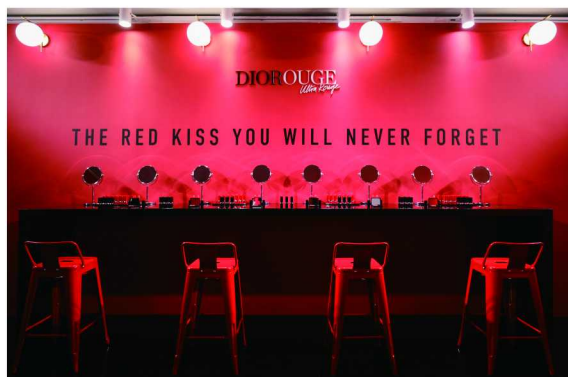
Dior迪奥烈艳蓝金挚红唇膏区域

近日，Dior迪奥在上海哥伦比亚乡村俱乐部，举办了2019年下半年香氛、彩妆及护肤新品鉴赏会。全国媒体及达人齐聚申城，与Dior迪奥一同见证新品鉴赏盛况。