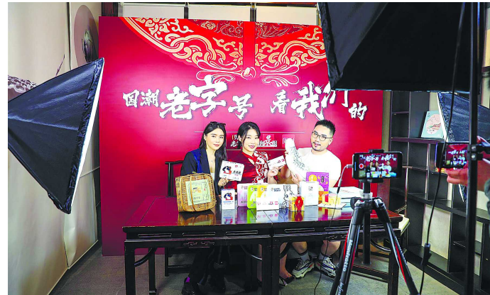
新闻晨报·周到记者主播团在直播间里给老字号品牌“撑腰带货”