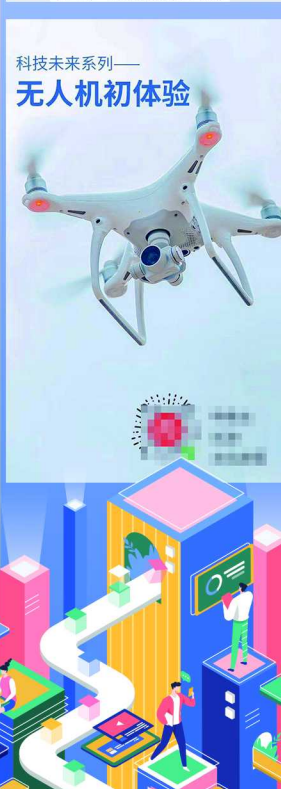
图片/晨报首席记者 张益维 制图/张继