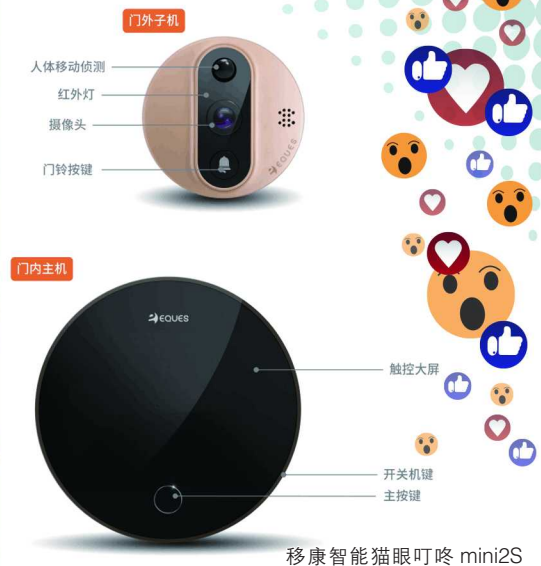
移康智能猫眼叮咚 mini2S