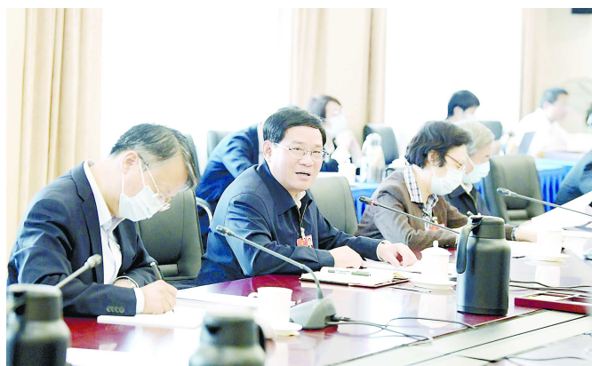
李强代表参加上海代表团分组审议