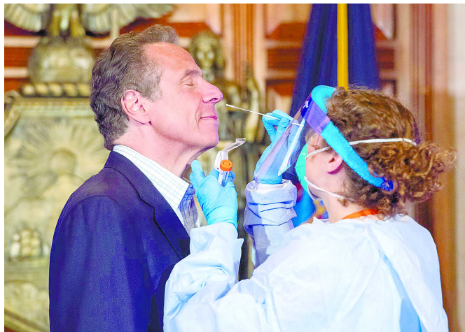
5月17日，纽约州州长科莫(左)与医生现场演示新冠检测过程。

这31家科学团体还在公开信中表示，眼下正是科学界需要公众信任携手抗疫之时，美国国家卫生研究院却选择此时将科学政治化。希望该机构能在此事的决策过程中“保持透明”，并立即重新考虑相关行动。